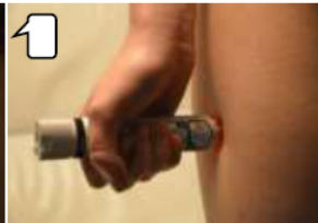
Drücken Sie den Fastjekt® / Fastjekt® Junior fest auf das Bein auf, bis ein Klicken zu hören ist, und halten Sie ihn 10 Sekunden lang fest.