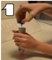
Die blaue Sicherheitskappe abziehen.